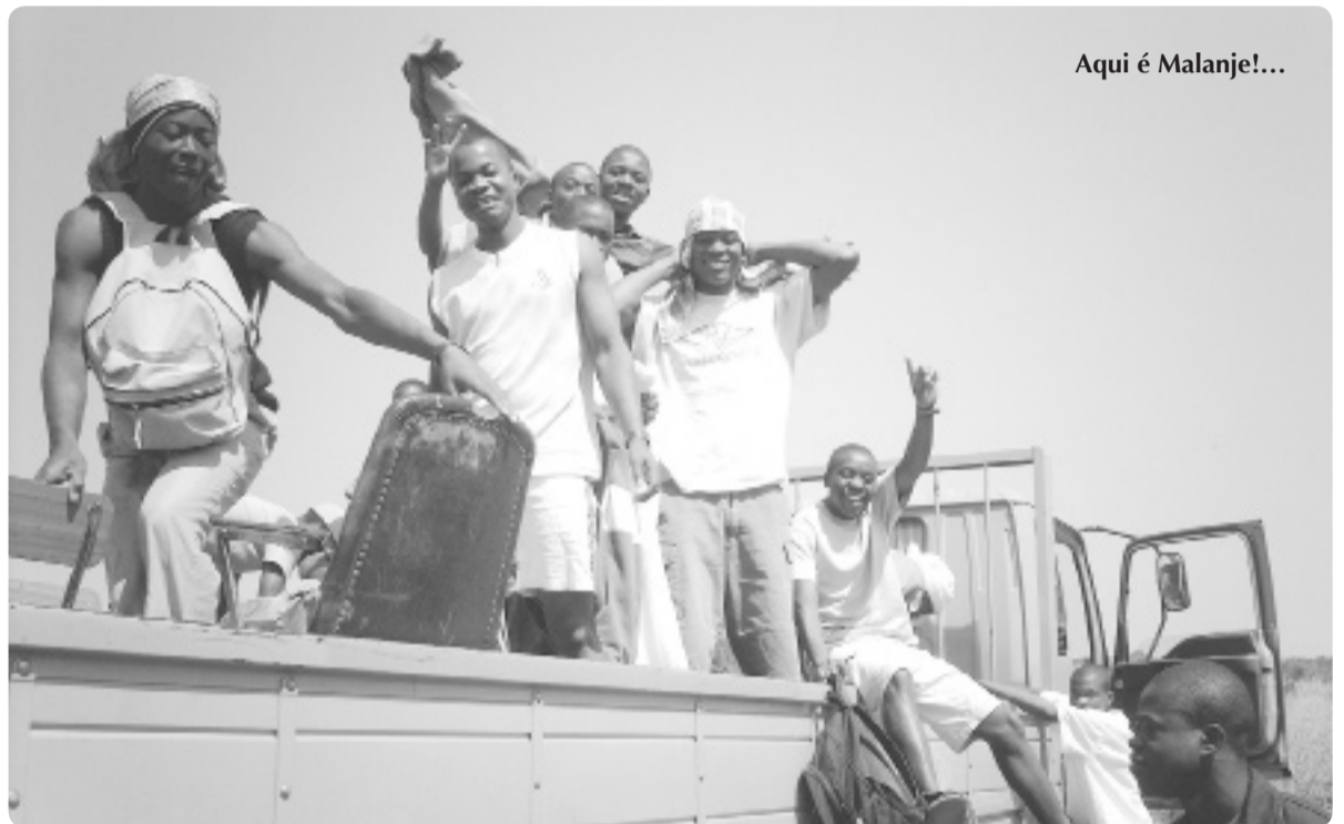
Aqui é Malanje!...

A todos os nossos Leitores, Amigos e benfeitores da Obra, desejamos um feliz Ano Novo cheio de prosperidade. □